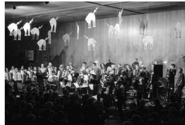
Alle Aktiven auf der Bühne (November 2001)

Der Laie ist immer wieder fasziniert davon und kann nicht recht begreifen, wie sich ein Akkordeonspieler z. B. in den 120 und mehr Knöpfen der Bassseite zurechtfindet, die er beim Spielen nicht sehen kann. Zur Beruhigung: Es ist alles nur eine Frage der Übung, (fast) jeder kann es lernen, unsere Schüler sind gerade damit beschäftigt und liefern den Beweis dafür, dass es zu meistern ist.